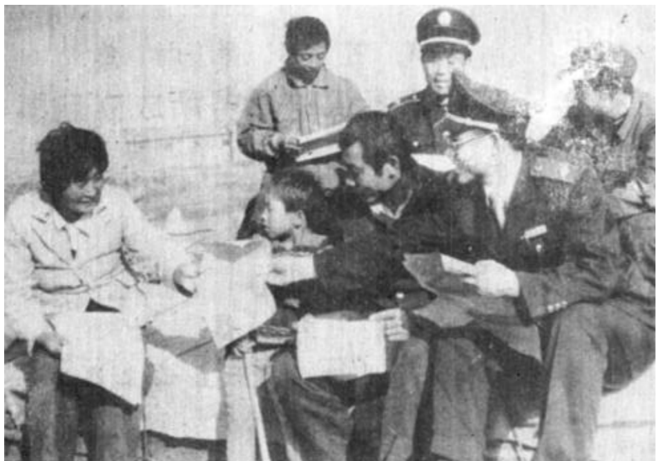
河口区国家税务局根据所辖户中渔民多且流动性大、居住分散的实际情况，采取“征税宣传同步进行”的办法，常年坚持送税法到海边、送税法到船头。图为税务干部正在向纳税渔民讲解税法。

本报讯 东营烟草分公司重视档案管理工作，1990年建立了综合档案室，统一保管文书、人事、财会、音像档案。经过近年来的努力，各类档案资料收集齐全，立卷规范，检索工具、库房设备齐全，充分发挥了档案室作为宝贵资料库的应有作用，达到了省二级先进单位标准。 该分公司领导把档案工作列入机关议事日程，及时研究，解决档案工作中的问题，并在人力物力上给予大力支持。按照档案升级标准，重新整理文书档案三百余卷，所有财会档案全部重新排列，装盒，编目，使各类档案归档进一步规范化。根据档案保管要求，几年来，他们共投资近四万元，购置了档案橱、去湿机、温湿度计、切纸机等，并安装了防盗门，确保档案安全。最近，东营烟草分公司档案安全工作通过市档案局的评审验收，晋升为省二级先进单位。（王秋凤）