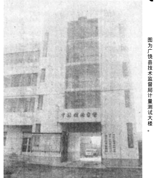
图为广饶县技术监督局计量测试大楼。