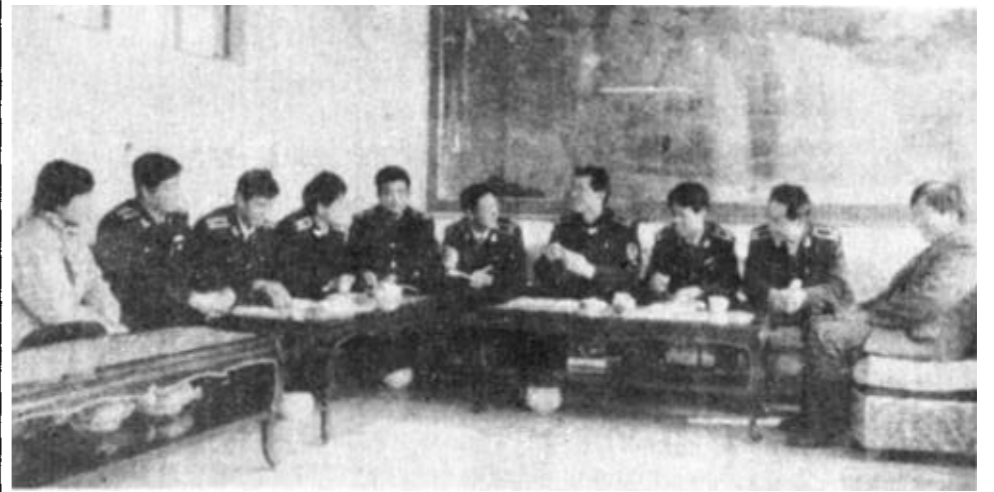
图为局领导和中层干部正在研究明年工作计划。

该局现有干部职工38人，其中技术人员32人，助理以上职称的26人，工程师2人，建有1150平方米的计量测试大楼，具有近30万元的计量测试标准器、产品质量检验仪器设备，年计量测试、检定计量器具万余台件，产品质量检验千余批次。成绩面前，该局没有满足，而是瞄准更高的目标奋进。